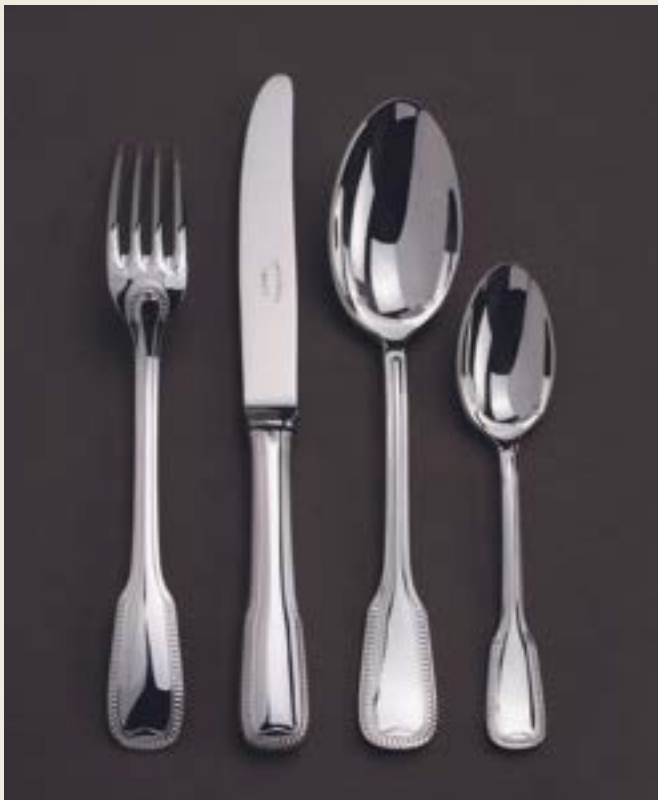
106. GODRON L+P

Ces modèles sont disponibles uniquement en taille bébé, lunch et dessert