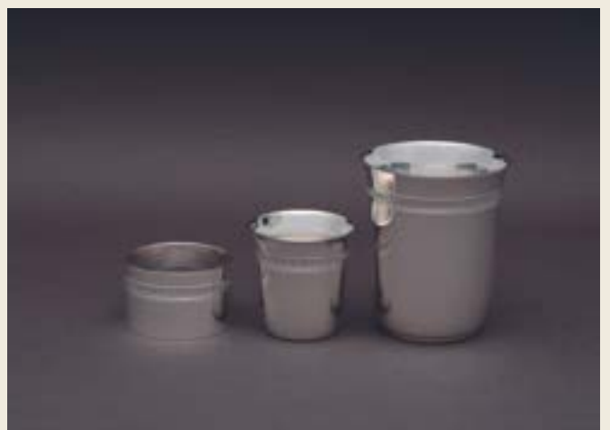
032. SIMPLE FILETS