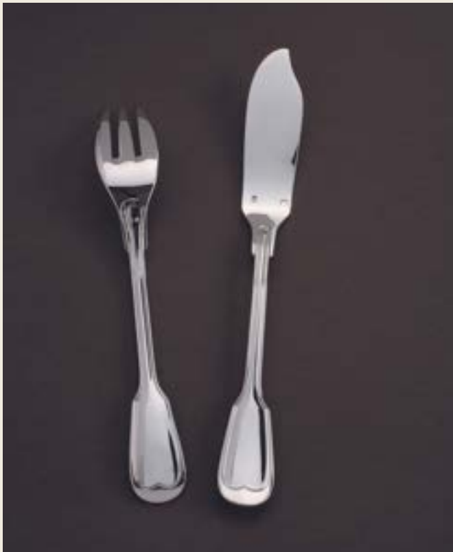
COUVERT À POISSON