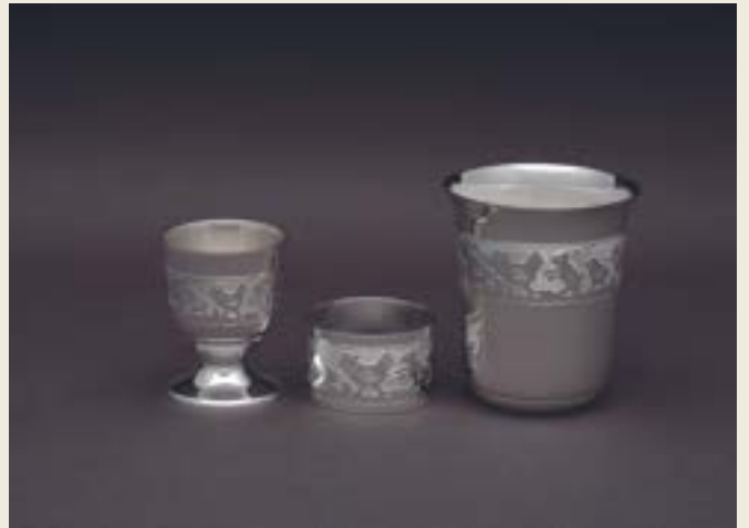
018. BASSE COUR