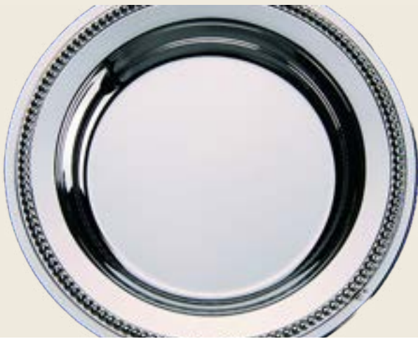
06. ASSIETTE À BOUILLIE PERLES