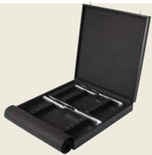
069. 12 TABLE ET 12 DESSERT