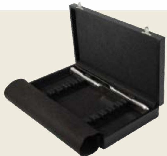
060. 12 COUTEAUX TABLE