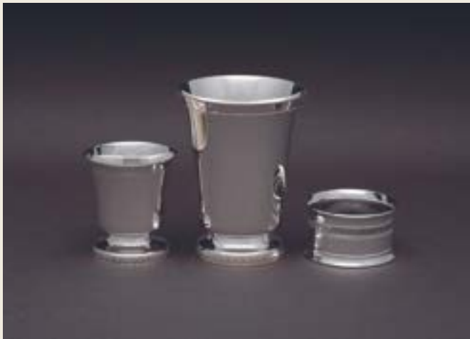
035. FILET SUR PIED EMPIRE