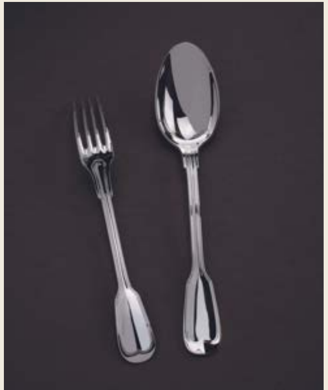
COUVERT DESSERT (19CM)