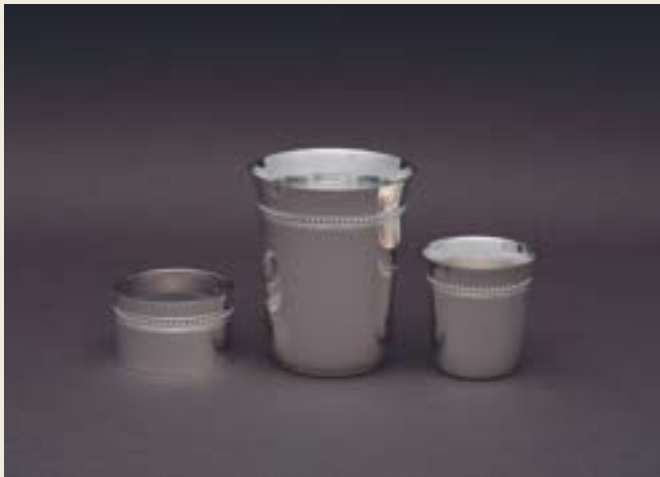
029. SIMPLE PERLES