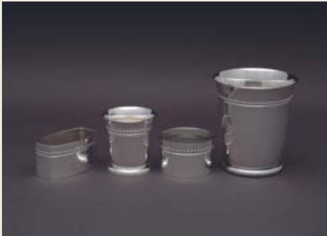
088. PERLES SUR PIED OURLÉ