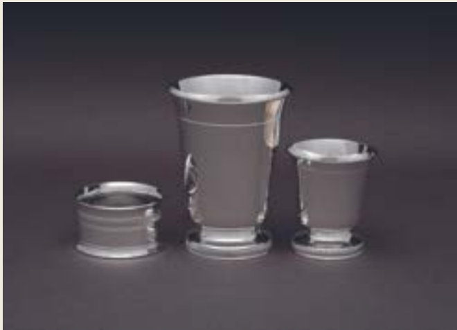
033. FILET SUR PIEDS GODRON