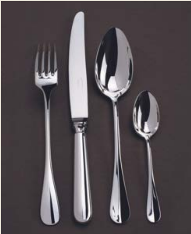
001. BAGUETTE L