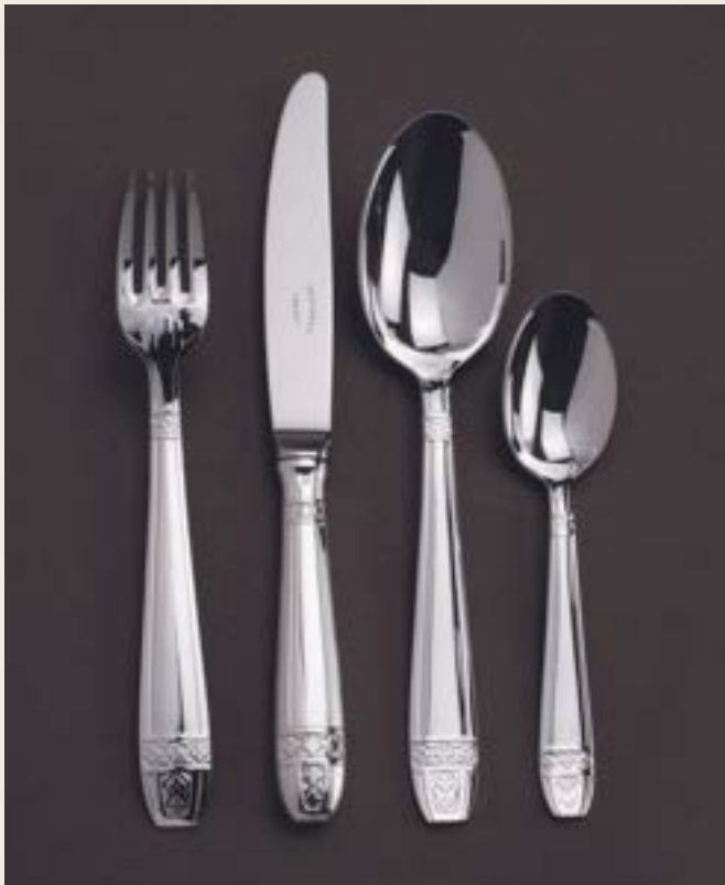
071. GRAND PRIX L