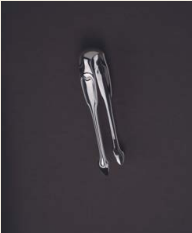
PINCE À SUCRE