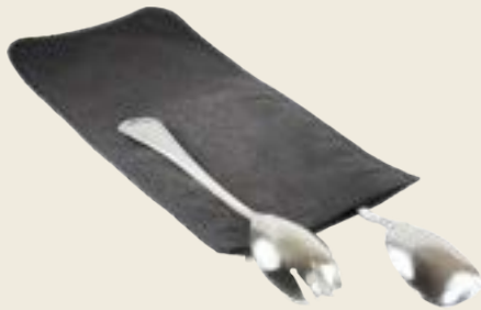
002. HOUSSE POUR 2 PIÈCES DE SERVICE