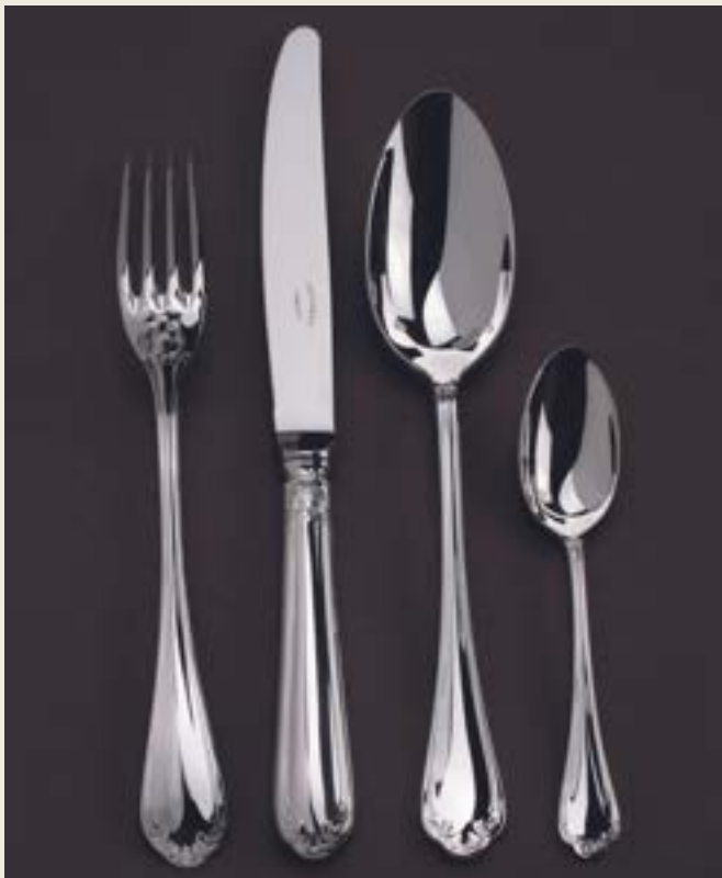
005. LOUIS XV COQUILLE L+P