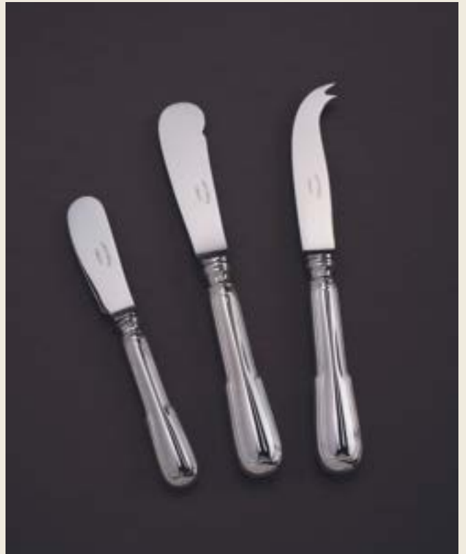
COUTEAUX TARTINEUR, BEURRE, FROMAGE