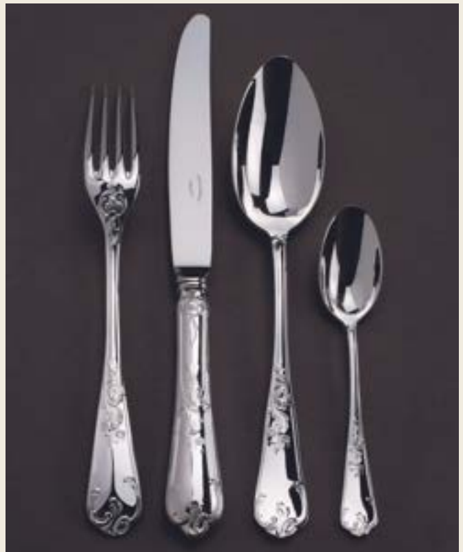
011. LOUIS XV RÉGENCE L+P

L : EXISTE EN LUNCH / P : PEUTÊTRE PATINÉ