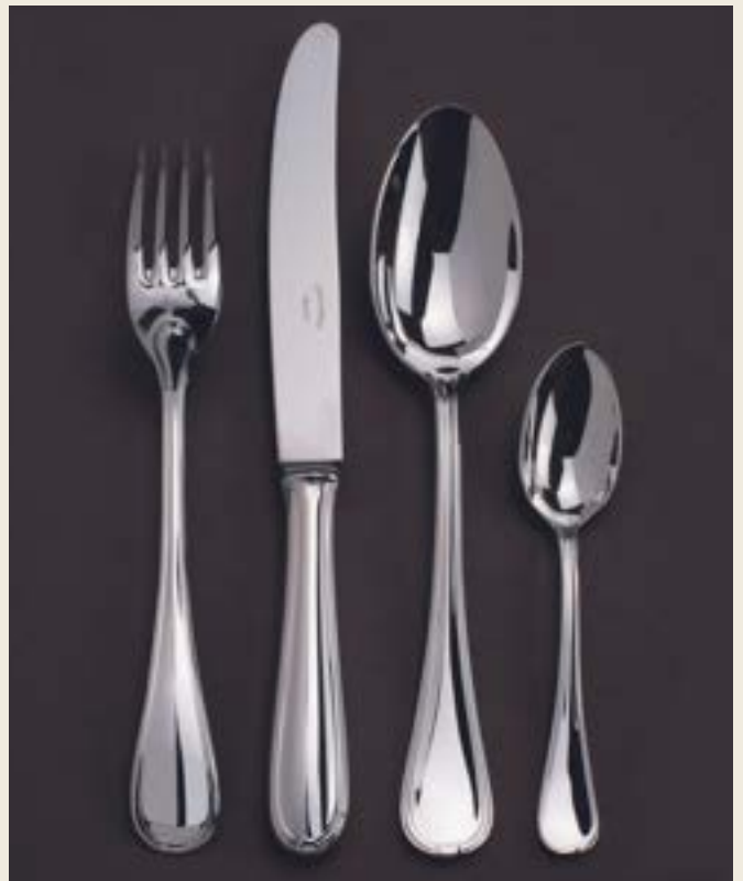
118. SENLIS L

L : EXISTE EN LUNCH / P : PEUTÊTRE PATINÉ