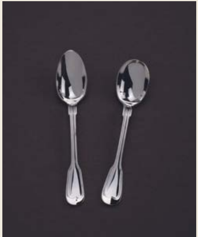
CUILLER MOKA (9CM), CUILLER OEUF