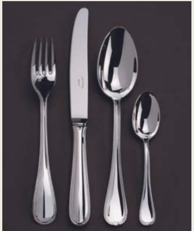
116. PERLES L+P