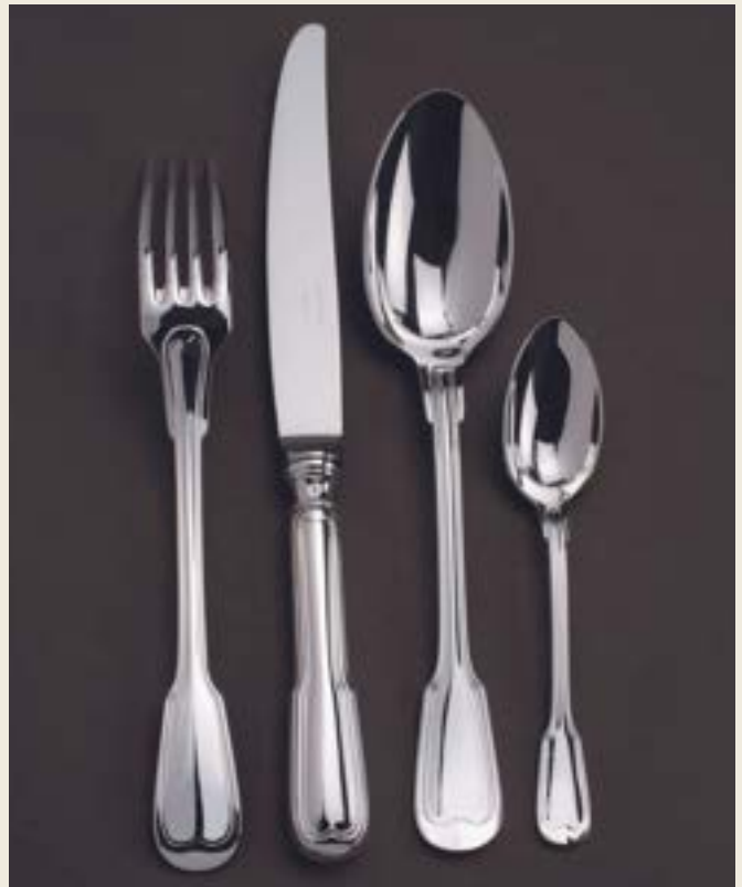
002. FILETS L