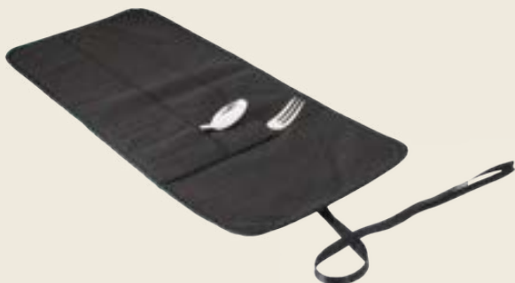
12GM. HOUSSE GRAND MODÈLE 12 PLACES