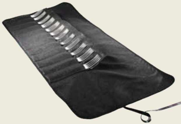
24GM. HOUSSE GRAND MODÈLE 24 PLACES