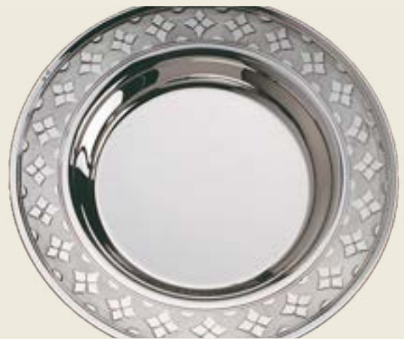
04. ASSIETTE À BOUILLIE GRAND PRIX

L'assiette à bouillie peut être assortie d'une cuiller panadière