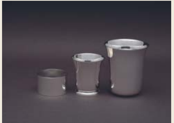
090. UNIE HAUTE