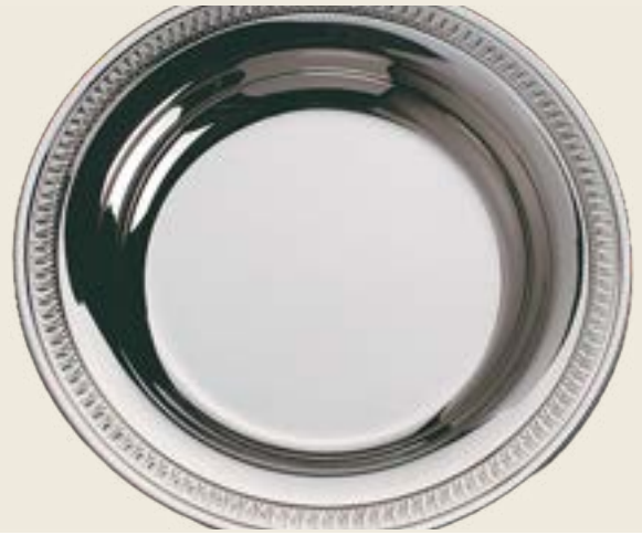
02. ASSIETTE À BOUILLIE EMPIRE