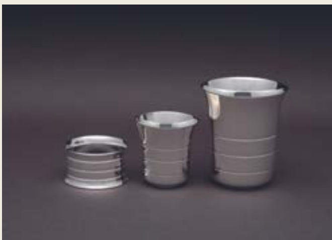
075. TROIS GORGES