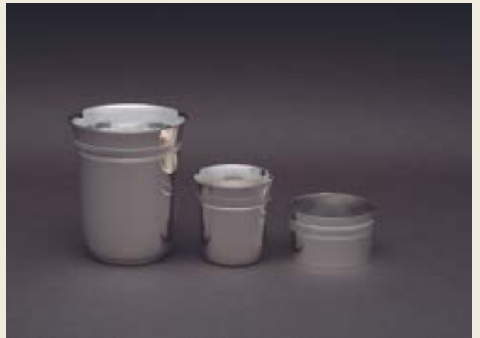
030. SIMPLE GODRON