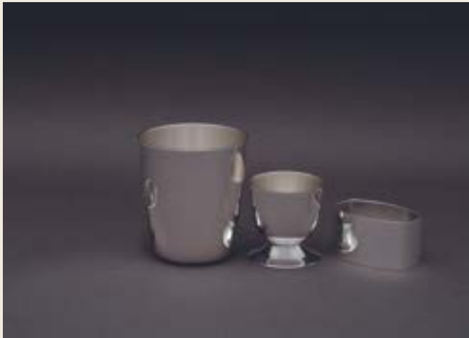
016. UNIES LARGE