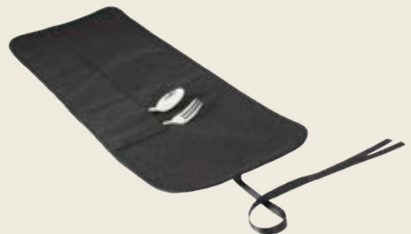
12PM. HOUSSE PETIT MODÈLE 12 PLACES