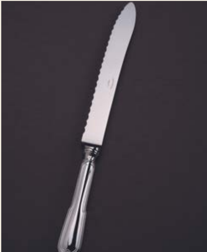
COUTEAU À PAIN