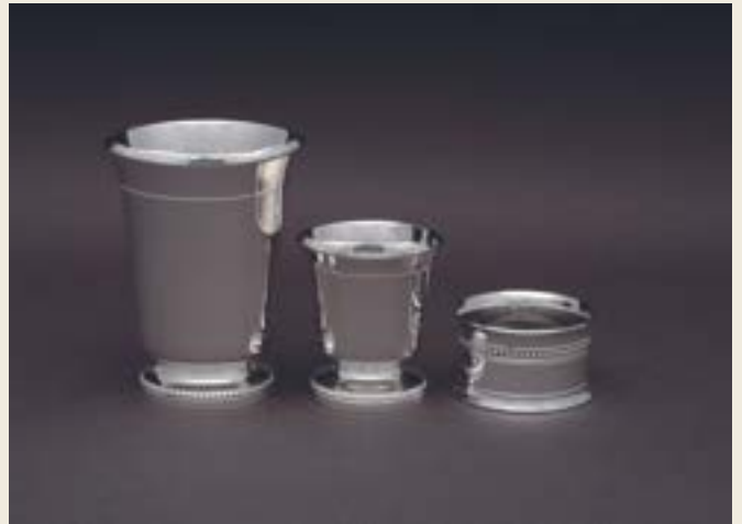
034. FILET SUR PIED PERLES