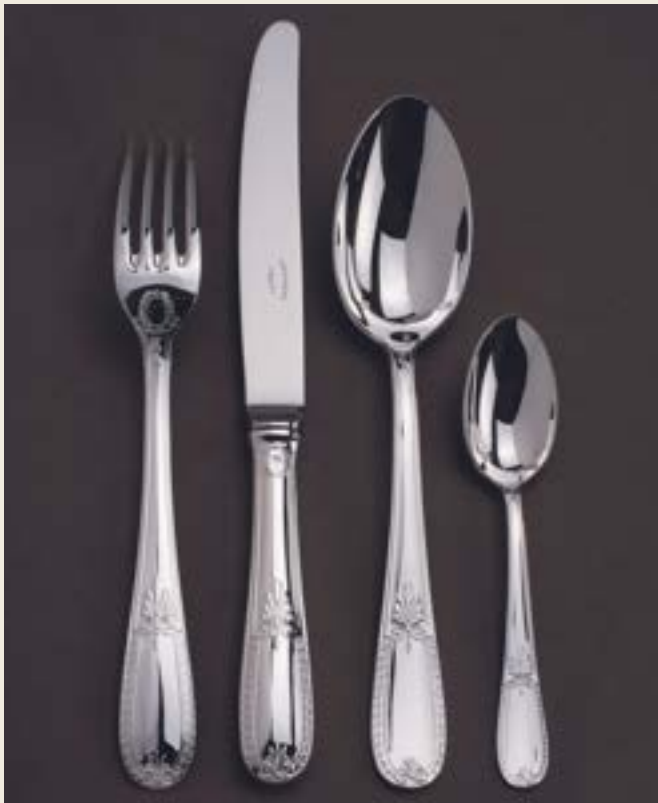
107. AIGLON P