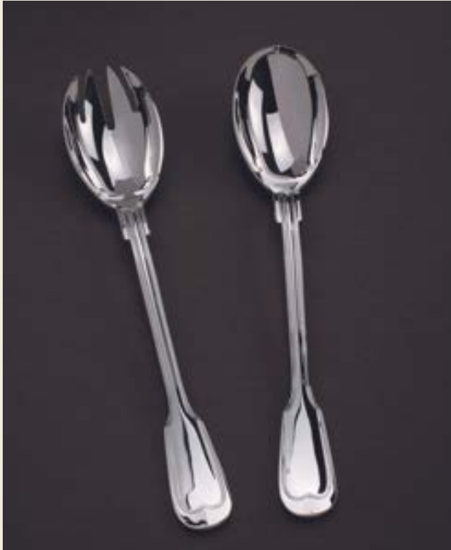
SERVICE À SALADE, MANCHE COUVERT