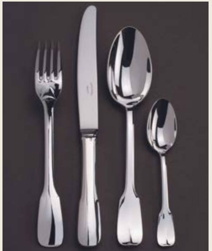
105. UNIPLAT L

L : EXISTE EN LUNCH / P : PEUTÊTRE PATINÉ