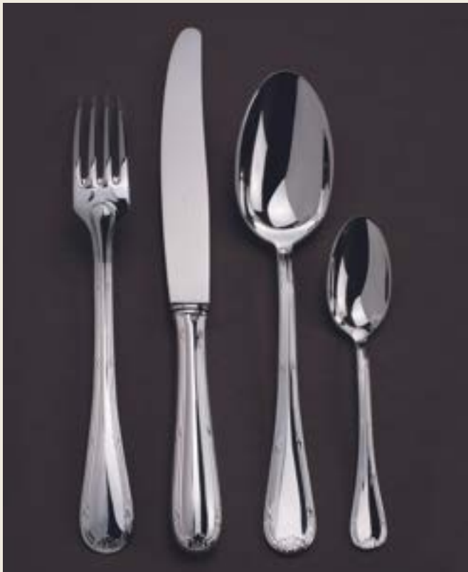
018. LOUIS XVI RUBANS P