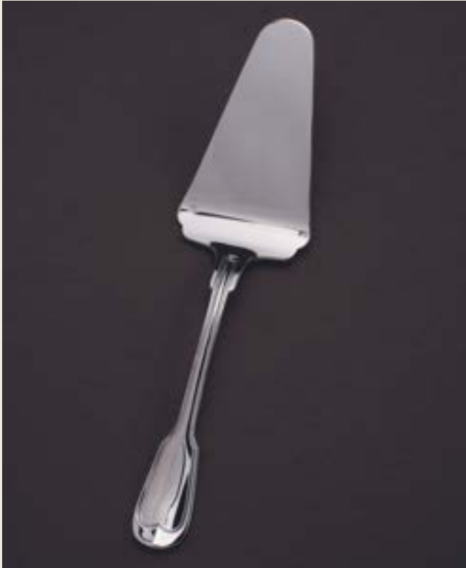
PELLE À TARTE, MANCHE COUVERT