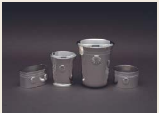
087. COQUILLES ET GORGES FILETS