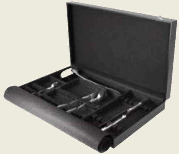
049. MÉNAGÈRE 49 PIÈCES