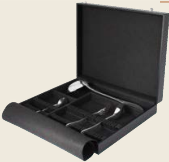
037. MÉNAGÈRE 37 PIÈCES