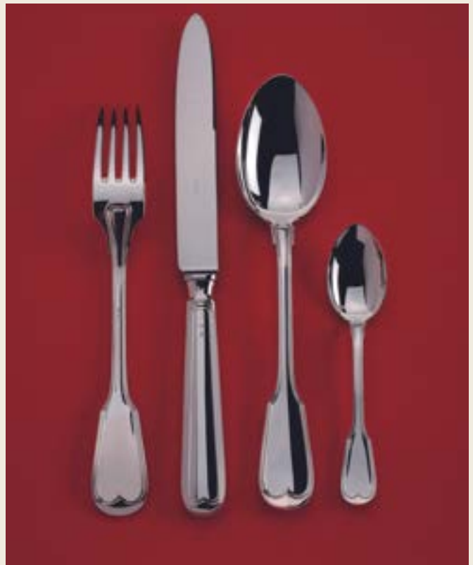
202 T. FILETS TRADITIONNEL