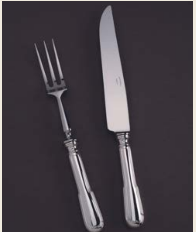
SERVICE À DÉCOUPER