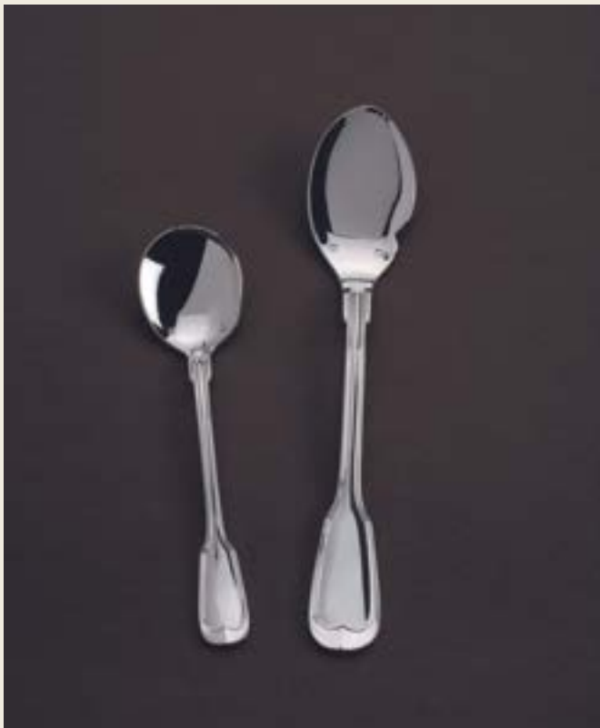
PELLE À GLACE, CUILLER À JUS ENCOCHE