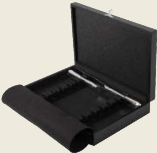
090. 12 COUTEAUX DESSERT