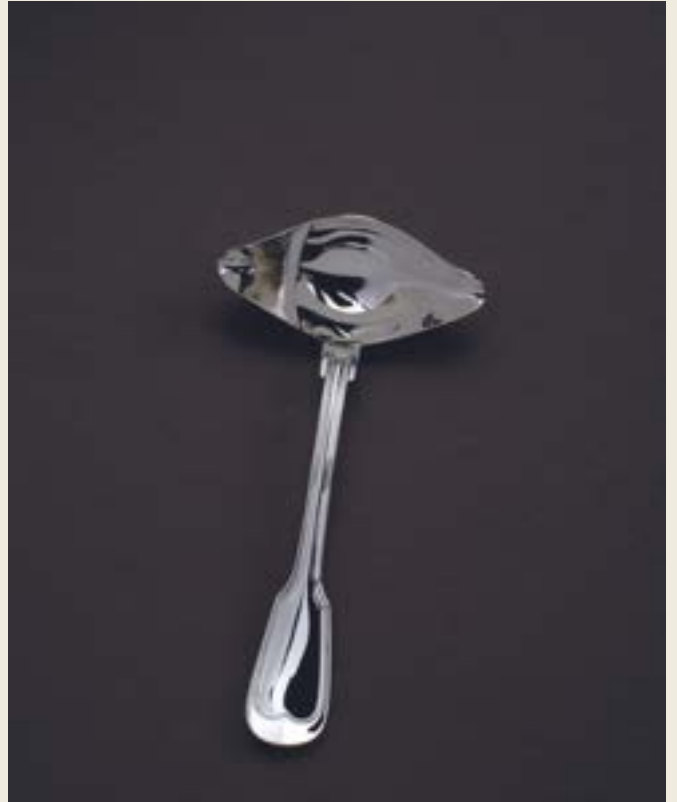
DÉGRAISSEUSE, MANCHE COUVERT