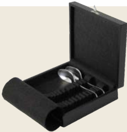
050. 12 COUVERTS CAFÉ OU FOURCHETTES GÂTEAU OU HUÎTRES