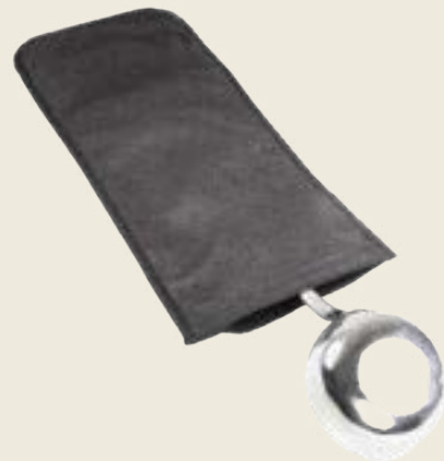
001. HOUSSE POUR UNE PIÈCE DE SERVICE