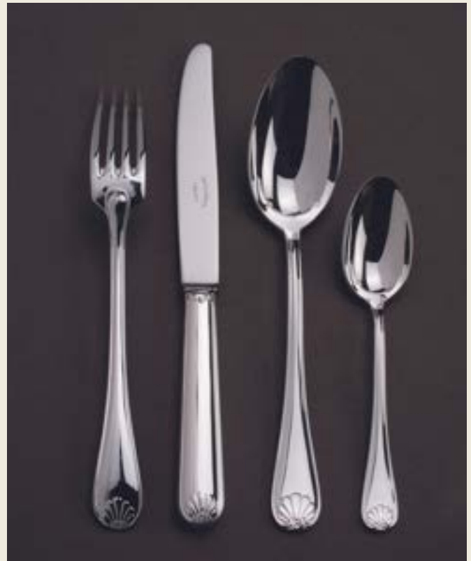
097. COQUILLE L