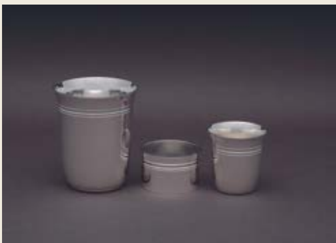
031. SIMPLE EMPIRE