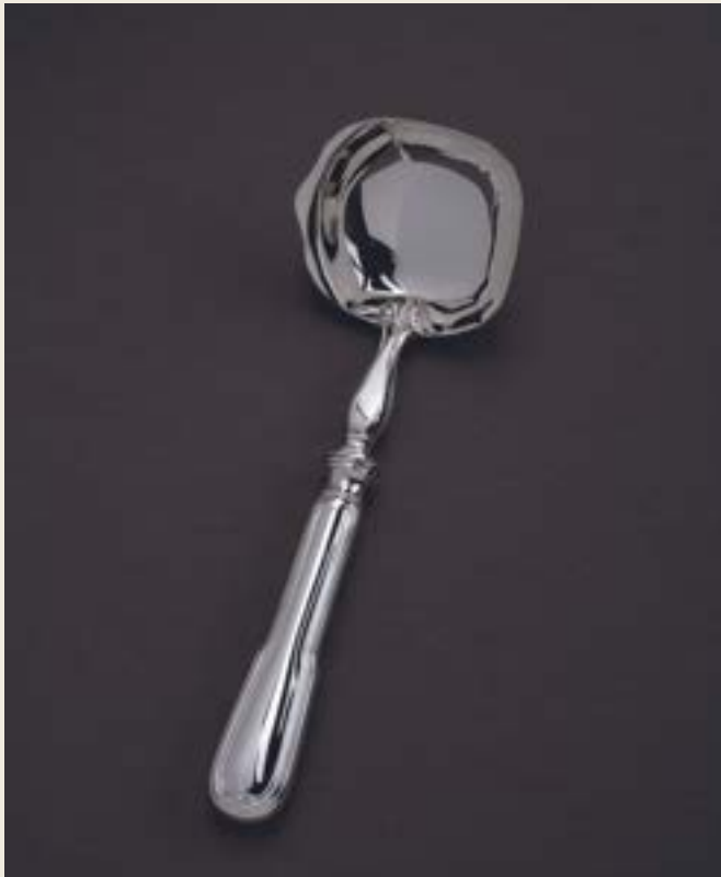
POCHE À CRÈME, MANCHE COUTEAU