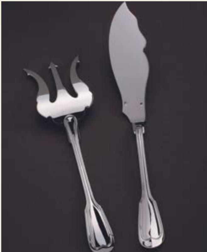
SERVICE À POISSON, MANCHE COUVERT