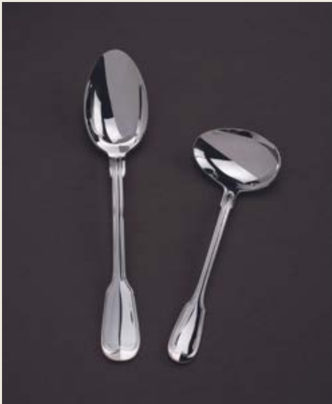
CUILER LUNCH (17CM), CUILER PANADIÈRE