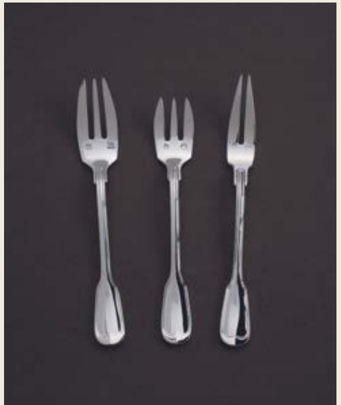
FOURCHETTES : GÂTEAU, HUÎTRE, ESCARGOT