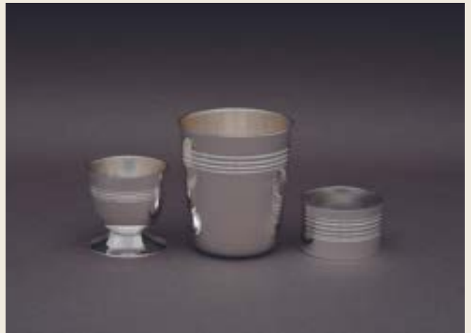
043. TROIS JONCS