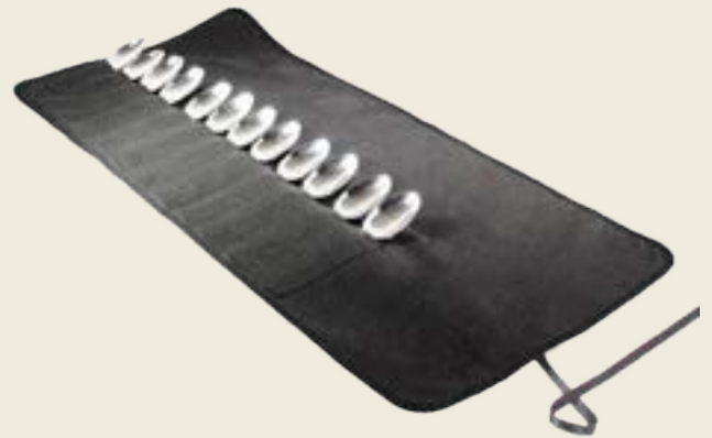
24PM. HOUSSE PETIT MODÈLE 24 PLACES