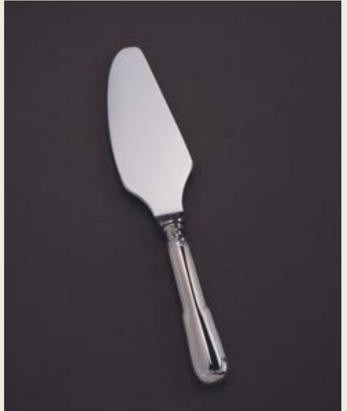
COUTEAU À PÂTISSERIE