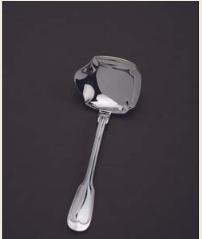
POCHE À CRÈME MANCHE COUVERT